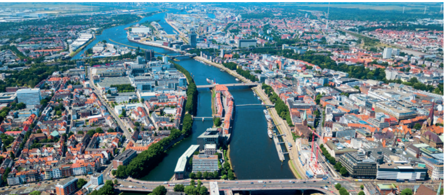
Bürogebäude der HTB Group in Bremen und Luftaufnahme der Bremer Innenstadt, im Hintergrund der Stadtteil Überseestadt (Sitz der HTB Group)